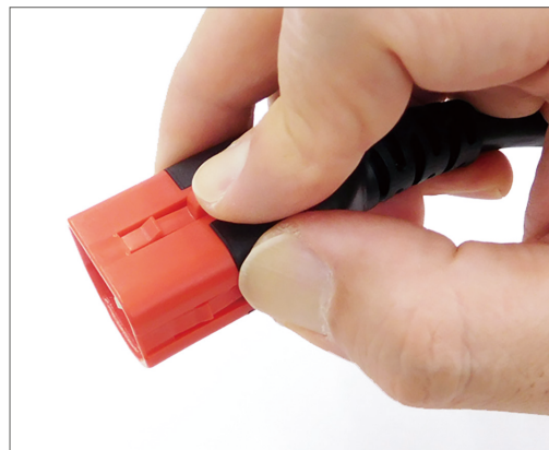
C14 プラグロック解除イメージ

アウトレットのスナップイン (溝) を利用して、センター又はサイド又は両方にコネクタのラッチ構造が嵌合しワンタッチでロックします。ラッチが嵌合するまで押込んでください。