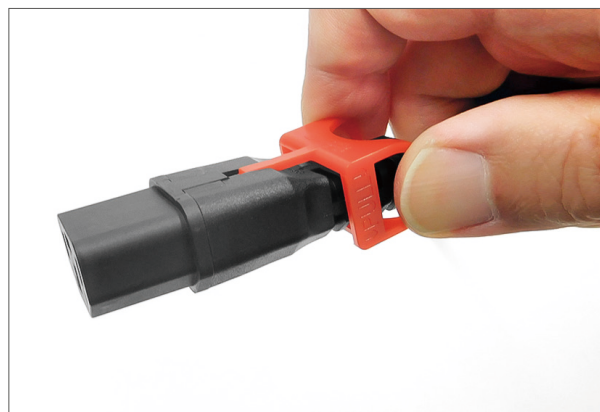
C13 ソケットロック解除イメージ