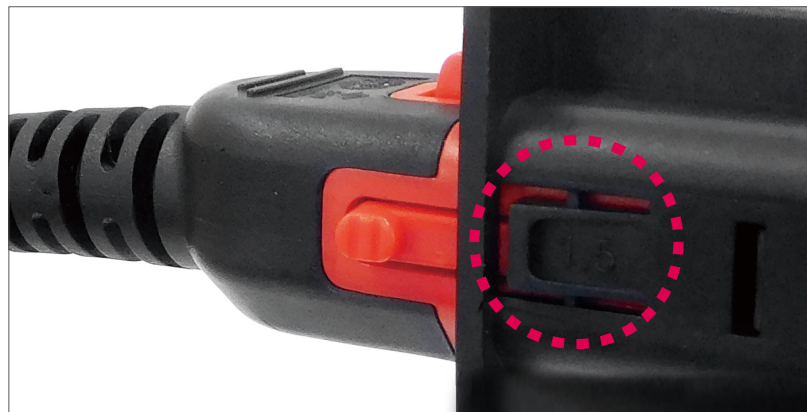
C14 プラグロックイメージ

アウトレットのスナップイン (溝) を利用して、センター又はサイド又は両方にコネクタのラッチ構造が嵌合しワンタッチでロックします。ラッチが嵌合するまで押込んでください。